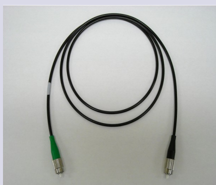
Cordon référence à gaine de polyuréthane

Le saviez-vous: contrairement aux gaines de PVC les gaines de polyuréthane vont conserver leur flexibilité (souplesse) de -40°C à 85°C. l'idéal pour un usage extérieur.